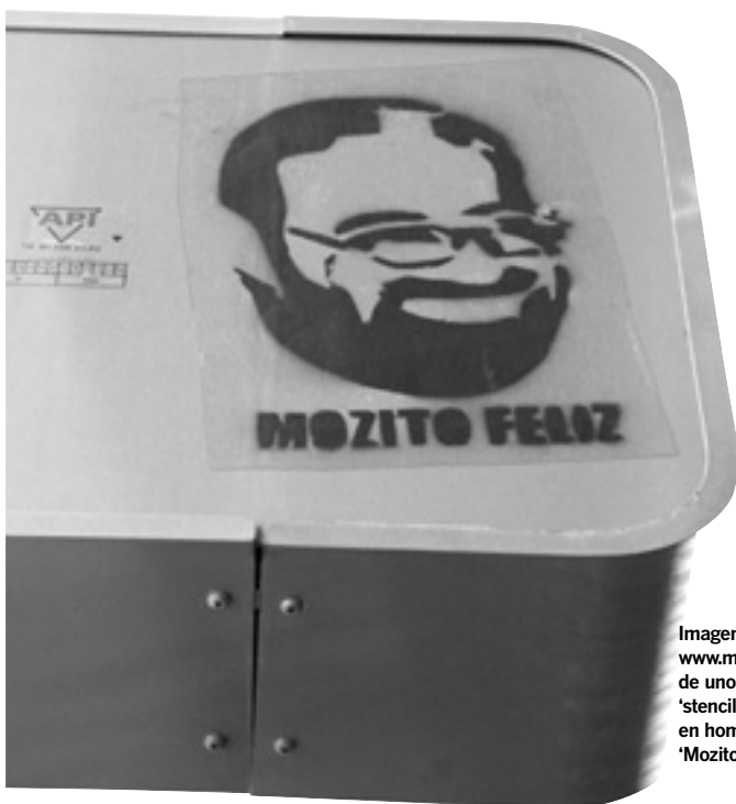
Imagen cedida por www.monmagan.com de uno de los 'stencils' de Málaga en homenaje al 'Mozito Feliz'.

Cartulina, vinilo adhesivo, cartón, plásticos con acetatos o radiografiados son los materiales usados para las plantillas, que no duran más de dos 'sprays'. "Se suelen hacer cuatro o cinco tiradas. Nunca encontrarás más de ocho o diez 'stencils' iguales", señala Magán.