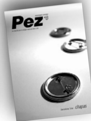
Chapas / Barcelona'zine nº8 / septiembre 09