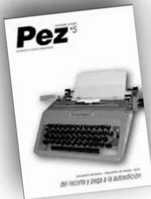
Del recorta y pega a la autoedición nº5 / enero 09