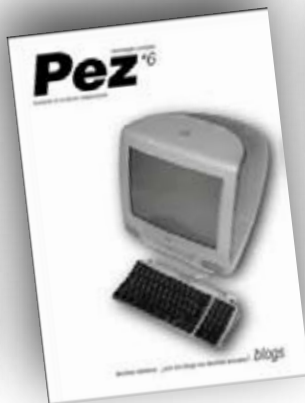
Blogs nº6 / marzo 09