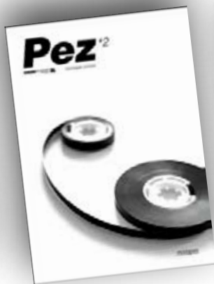
Mixtapes nº2 / mayo 08