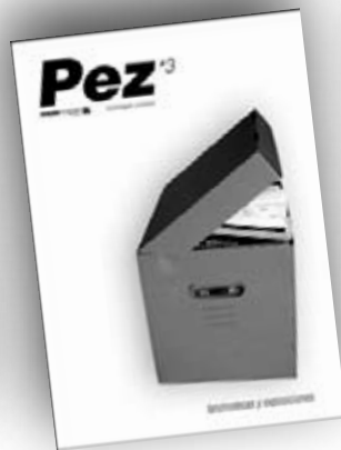
Fanzinotecas y exposiciones nº3 / julio 08