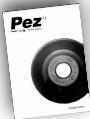
Presentación nº1 / abril 08

Mon Magan / Apdo. 20.004 / 29080 Málaga correo@monmagan.com