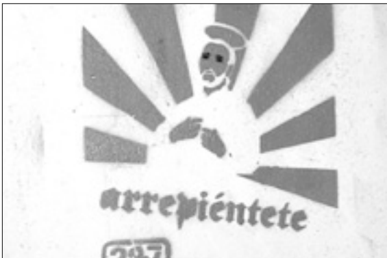
Imagen de un 'stencil' que muestra un característico mensaje.