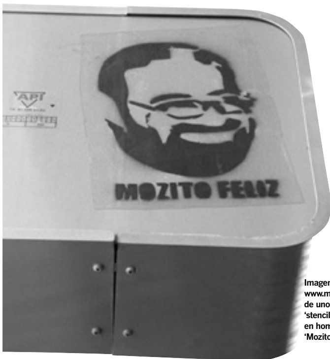
Imagen cedida por www.monmagan.com de uno de los 'stencils' de Málaga en homenaje al 'Mozito Feliz'.

Cartulina, vinilo adhesivo, cartón, plásticos con acetatos o radiográficas son los materiales usados para las plantillas, que no duran más de dos 'sprays'. "Se suelen hacer cuatro o cinco tiradas. Nunca encontrarás más de ocho o diez 'stencils' iguales", señala Magán.