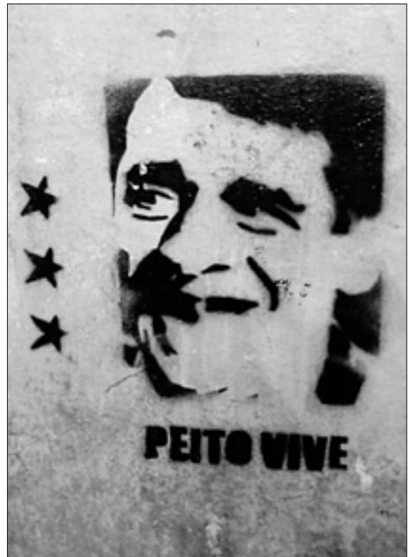
Un 'stencil' en reconocimiento al desaparecido 'Peito'.

Nosferatu, el Mozito Feliz y Bruce Lee ('Bigote my friend') son ejemplos de ello.