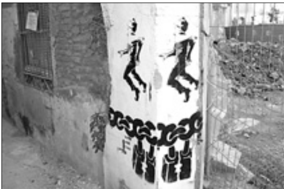
Un curioso dibujo en una calle malagueña.