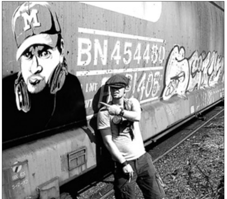
La técnica del estarcido se puso de moda en los Estados Unidos en la década de los sesenta.