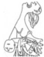
Una plantilla del 'Guernica'.

"La mayoría de los 'stencils' se hacen con ordenador. Se escoge una fotografía, se hace la silueta de la imagen con programas como Photoshop o los vectoriales, se imprime el producto y se pasa a la plantilla", explica Magán, que cuantifica hasta en días la labor de diseño de algunos 'stencils'.