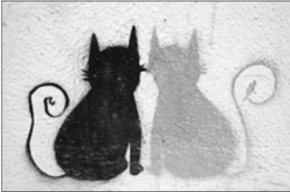
Pintada de una pareja de gatitos, cedida por www.monmagan.com

Una marcha multitudinaria inicia el VII Foro Social Mundial en Nairobi P. 46