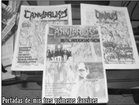
Portadas de mis tres primeros fanzines

Corrían los primeros días de diciembre de 2006 cuando decidí hacer realidad un sueño que tenía desde que me involucré en esto del metal. Tal sueño era elaborar mi propio fanzine. Antes de esa fecha, era un fanático de revistas dedicadas al rock y metal (bueno, continué siéndolo). Las adquiría de todo tipo: desde aquellos elaborados en papel couche a todo color, hasta esos fotocopiados y con diagramación sencilla pero efectiva. Sin duda éstos últimos son los que más me atraen. Una meta que aún debo cumplir, es que algún número futuro de Cannibalism deberá ser hecho con el método DIY (Do it yourself: hazlo tú mismo). Es decir, con eso del recorta y pega, textos a mano o a máquina de escribir, recortes de periódicos, entre otros.